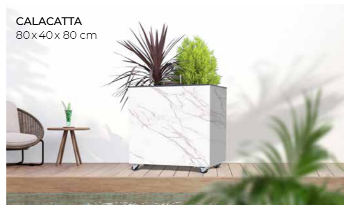
CALACATTA 80x40x80 cm