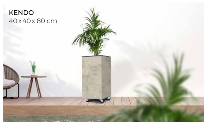
KENDO 40x40x80 cm